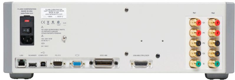
Zwei Eingänge für Referenzwiderstände auf der Rückseite halten Kanäle auf der Vorderseite frei für Referenzthermometer und zu prüfende Einheiten.

Mit einem Eingangswiderstandsbereich von 0 bis 500 kΩ und einem Verhältnisbereich von 0 bis 10 ist das Super-Thermometer die perfekte Wahl für eine breite Palette von Sensortypen.