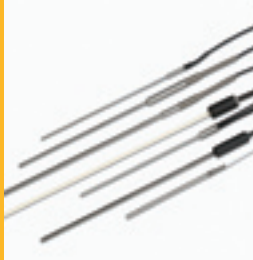
Kalibrierte Temperatur- sensoren

Eine breite Vielzahl an Zubehör hilft Ihnen dabei, Ihre Produktivität zu optimieren. Das folgende Zubehör ist für die meisten Benutzer von größter Wichtigkeit.