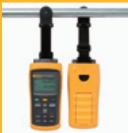
TPAK Magnet- halter