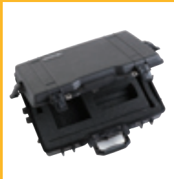
Hartschalen- koffer für Messfühler und Messgerät