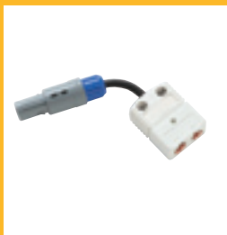
Universal- Thermoelement- adapter